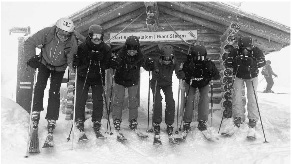
Mutiger Start ins ungewisse Weiss.

Ohne grosses Verkehrsaufkommen kamen wir sicher an der Talstation Silleren/Oey an. Unterwegs haben wir uns mit Zopfchnöpfli sowie Schoggi- und Kaffeedrink gestärkt, damit wir bis zum Mittagessen durchhalten. Den Rucksack angeschnallt und die Skier gepackt, bewegten wir uns zur Gondelbahn. Hoch auf den Sillerenbühl, auf den Latten rüber nach Geils, rauf zum Hahnenmoos, wo wir unser Gepäck im Skiraum deponierten, bis wir unsere beiden Massenschläge beziehen konnten. Nun, ohne Gepäck, ab auf die Piste, was aber mit einer Sicht von Weiss in Weiss leider keinen Spass machte. Schon bald haben wir uns im Restaurant Ötzi-Bar zum z'Mittag getroffen. Die einen hielten es dort ein wenig länger aus und die anderen versuchten nochmals die Pisten zu finden.