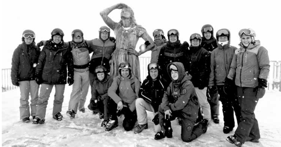
Trotz widriger Umstände fröhlich und zuversichtlich!

Nach unterschiedlich ruhiger Nachtruhe trafen wir uns am Morgen zum reichhaltigen z'Morge. Dies auch wieder am Selbstbedienungsbuffet. Essen was das Herz begehrt! Die Hoffnung auf besseres Wetter und die Lust, die frischen Pisten hinunter zu stechen, vergingen uns schnell. Gleiche Sicht wie am Samstag, nämlich keine... Trotzdem haben wir uns ins Schneegestöber gewagt und schon bald herausgefunden, dass die Sicht in den unteren Lagen besser war. Somit versuchten wir uns unter 1800 Meter aufzuhalten. Die einen mit Vollgas von Schneebar zu Schneebar, die anderen eher gemütlich und schon bald mit dem Einkehrschwung ins Restaurant Aebi wo wir uns zum z'Mittag verabredet hatten. Nach dem Essen beschlossen wir, die Rückreise anzutreten. Gepäck holen, welches wir auf dem Sillerenbühl zwischengelagert hatten, Zwischenhalt in der Sagibar zum letzten Shot mit Bier und dann ab auf die Talabfahrt, welche unsere Snowboarderin wohl bis heute verflucht... Sie hätte im Nachhinein wohl lieber die Gondelfahrt gewählt, oder?