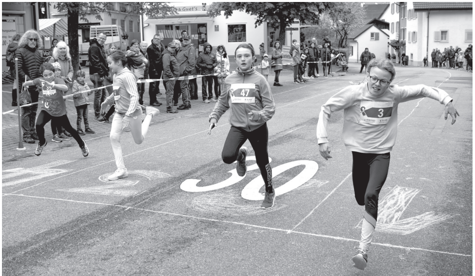
Finaleinlauf der Mädchen 2012/2013.