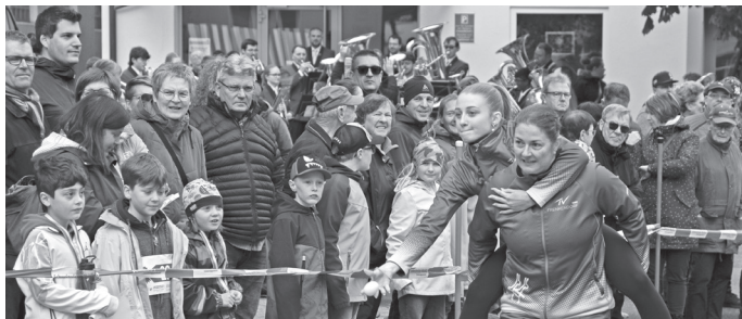
Das Eierwybli auf der Laufstrecke, Eiertransport im Huckepack und die teilnehmenden Teams.