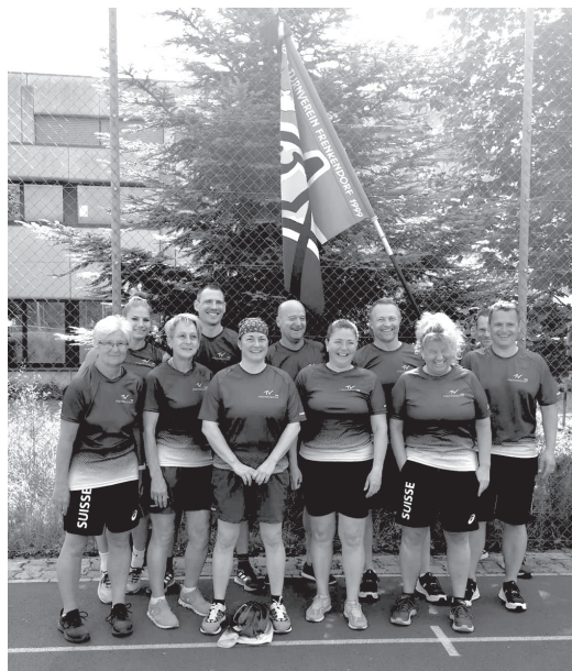
Team 35+ mit Turnerinnen und Turnern aus der AR, FR, MR und VR: 1. Rang im Kugelstossen und 2. Rang im Steinstossen.

Passend zur Verabschiedung durch den Speaker leerten sich die Wolken, was jedoch die Stimmung keineswegs trüben liess. Wir reisten trotz Platzregen glücklich wieder nach Frenkendorf und liessen den Abend im Restaurant Central ausklingen.