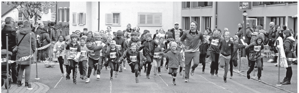
Anwärmen bei kühler Witterung.

83 Jugendliche und Kinder liessen sich durch die ungünstigen Wetterprognosen nicht davon abhalten, am Sonntag, den 16. April 2023 am traditionellen Schnelllauf-Wettbewerb auf der Hauptstrasse in Frenkendorf an den Start zu gehen. Mit der kühlen Witterung kamen sie gut zurecht, und sie mussten erfreulicherweise keine Regenschauer erdulden. Al.