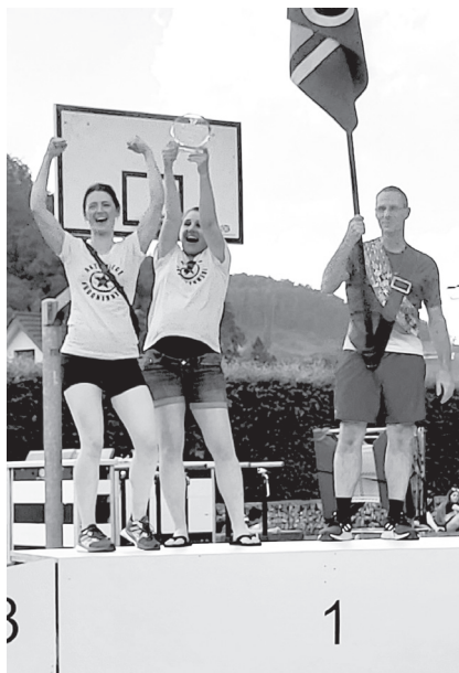
Mehrfacher Titelverteidiger: Die Aktivriege am Schulstufenbarren.