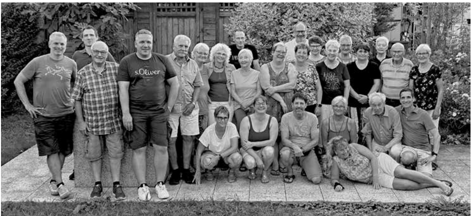
Die TVF-Ehrenmitglieder und Vorstandsmitglieder beim Fototermin.