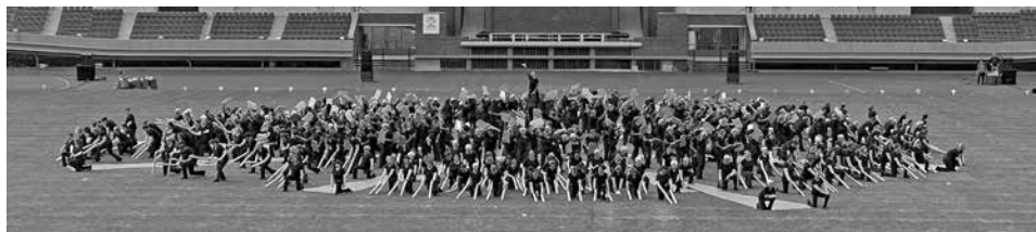
Grossgruppe Schweiz am 3. August 2023 im Olympiastadion.

23 Turnerinnen aus Turnvereinen im ganzen Kanton Baselland besuchten die World Gymnaestrada 2023 vom 30. Juli bis 5. August 2023 in Amsterdam. Zwei Jahre lang wurde für die schweizerische Grossraumvorführung regelmässig trainiert.