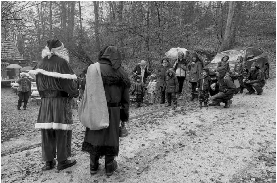
TVF-Familien-Chlaushock 2022: Freudiger Empfang des Santichlaus mit seinem Schmutzli.