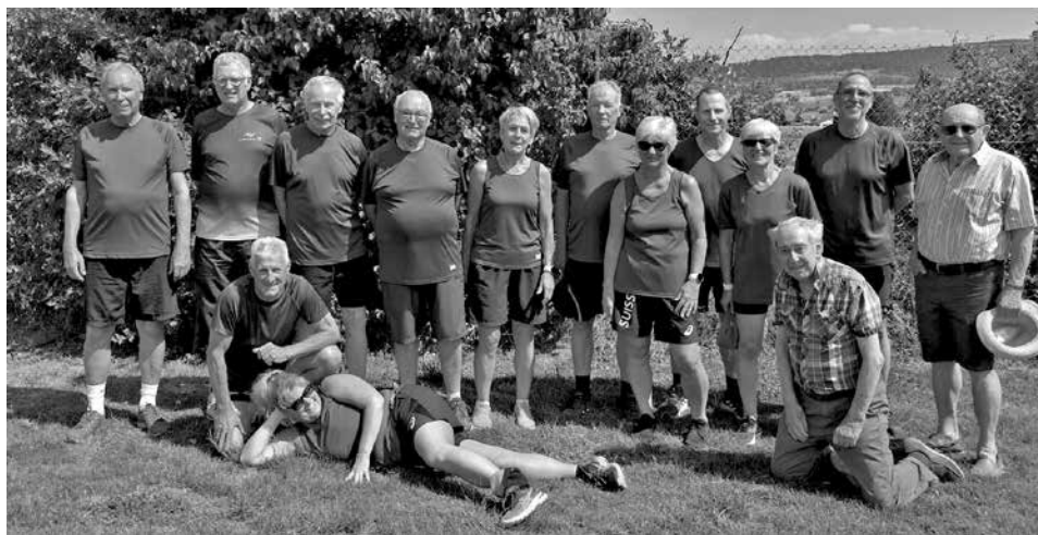
RTF Breitenbach, 17.06.2023: TVF 55+ mit Schlachtenbummlern.

1. Gunzgen TV ü35, 26.82, 2. Laufen TV ü35/55, 26.37, 3. TV Frenkendorf 55+, 24.95