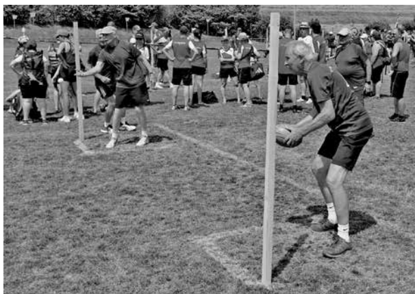
TVF 55+ beim Fit und Fun.

Al. Wie der 3-teilige Vereinswettkampf der Senioren am 17. Juni 2023 am Regioturnfest in Breitenbach für die 12 Turnerinnen und Turner des TVF gelingen wird, war lange ungewiss. In den Trainings gelangen die Abläufe im Fit und Fun manchmal perfekt, manchmal fehlerhaft. Das Ziel, mit 12 Turnenden zu starten, um alle Disziplinen immer mit 2 bis 3 Gruppen zu absolvieren, war gefährdet, als