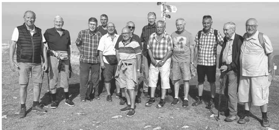
Männerriege am 8. September 2023 auf dem Belchen