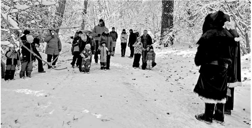
Gross und Klein in freudiger Erwartung.

Wer am 3. Dezember 2023 den Weg zum TVF-Familien-Chlaushock unter die Füsse nahm, durfte den Winter mit Sonne und Schnee von seiner schönsten Seite erleben. Im Felsenheim hatte die Männerriege alles vorbereitet, damit die kleinen und grossen Gäste einen geselligen Nachmittag verbringen und sich verpflegen konnten.