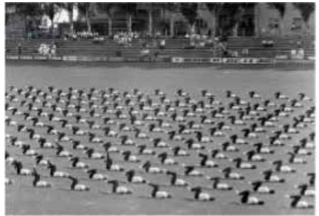
Gymnaestrada 1969 in Basel

Vom 2. bis 6. Juli 1969 fand die 5. Gymnaestrada mit 9'600 Teilnehmenden in Basel statt. Die Damenriege Frenkendorf war bereits zu dieser Zeit mit dabei und konnte an den Allgemeinen Vorführungen mitwirken.