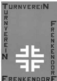
Umschlag 1972 - 1985

Denkbar knapp mit 20:16 Stimmen beschloss die bis dahin eigenständige Frauenriege am 20. August 1970 als Untersektion dem Turnverein Frenkendorf beizutreten. Ab fortan waren Frauen und Männer in einem Verein vereint.